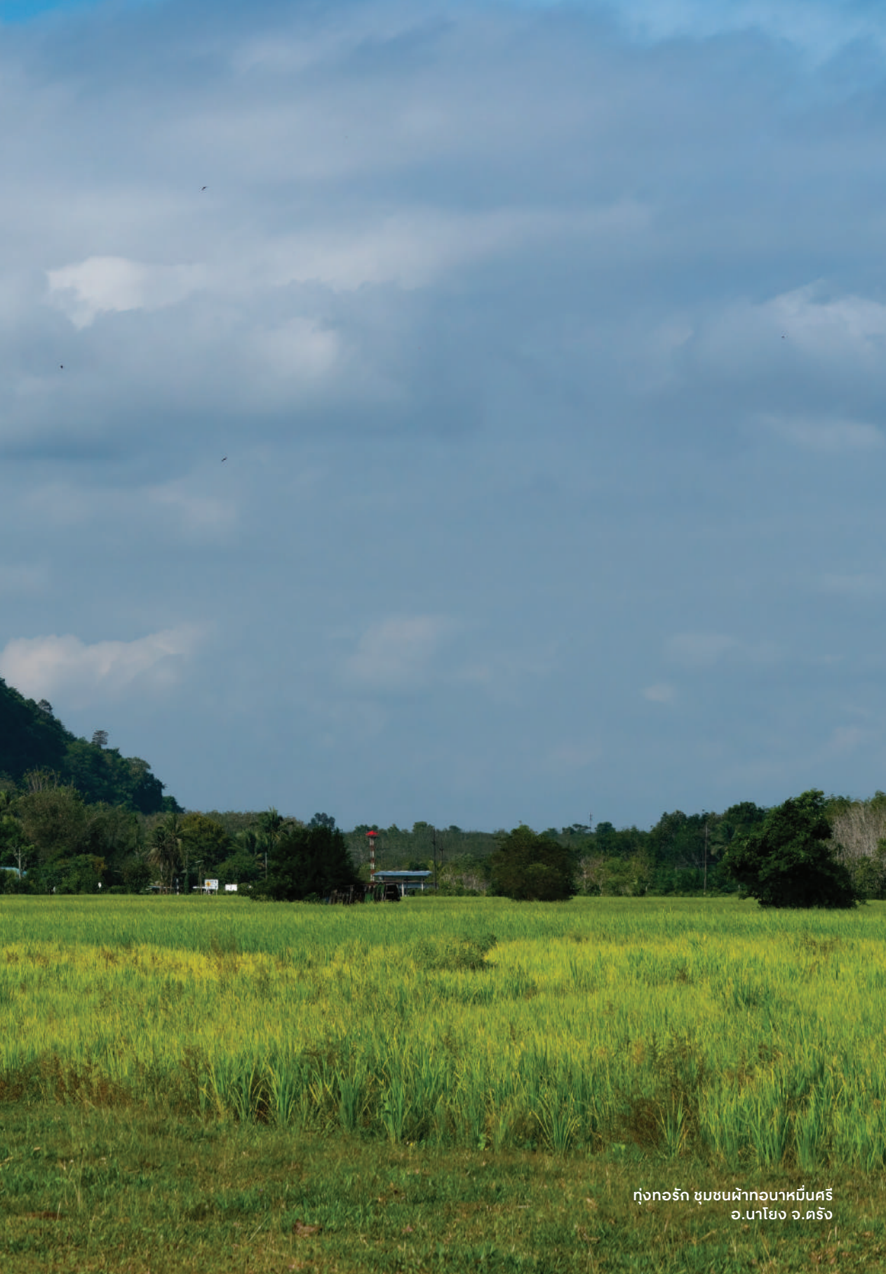
ทุ่งทอรัถ ชุมชนผ้าทอภาคอีสาน อ.นาโยง จ.ตรัง